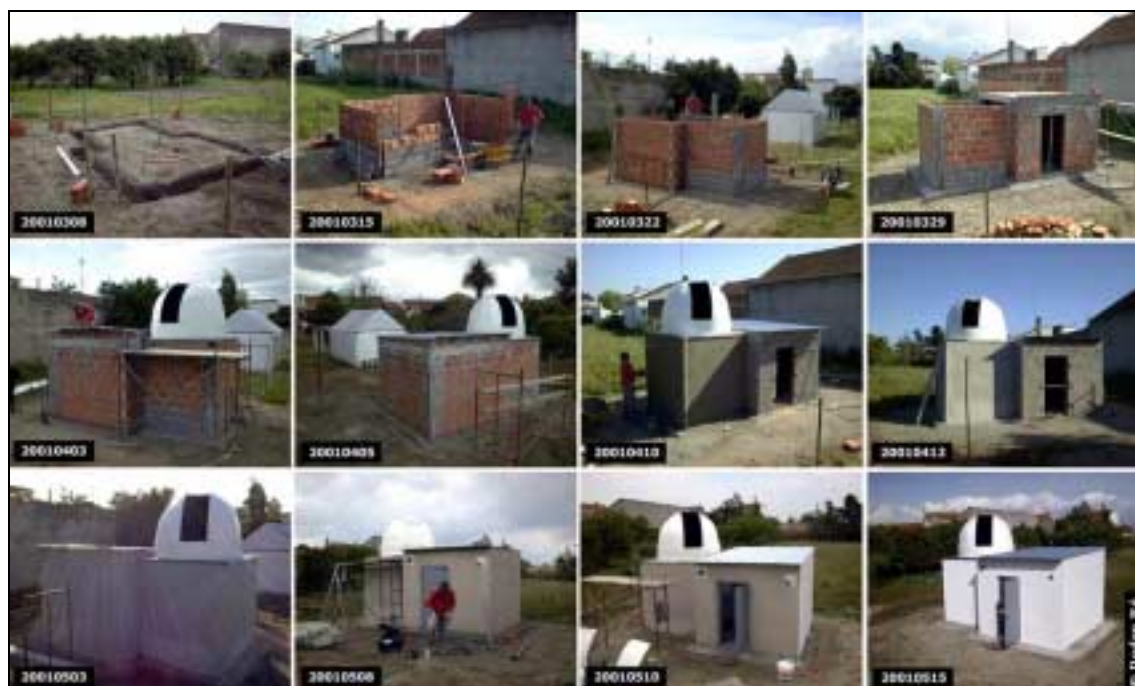
Figura 2- Fases da construção do observatório (20010308/20010515).

Esta estrutura móvel foi montada numa instalação fixa composta por dois módulos distintos (Figura 1). Um dos módulos suporta a cúpula enquanto que o outro serve de apoio. É neste anexo que estão instaladas todas as estruturas e acessórios utilizados durante as sessões de observação e de obtenção de imagens. A construção dos dois módulos foi realizada em pouco mais de 2 meses (Figura 2), recorrendo aos materiais habituais (tijolo de 11x20x30). O módulo de apoio foi coberto por uma placa em betão armado e por um telhado em zinco ondulado (Figura 3).