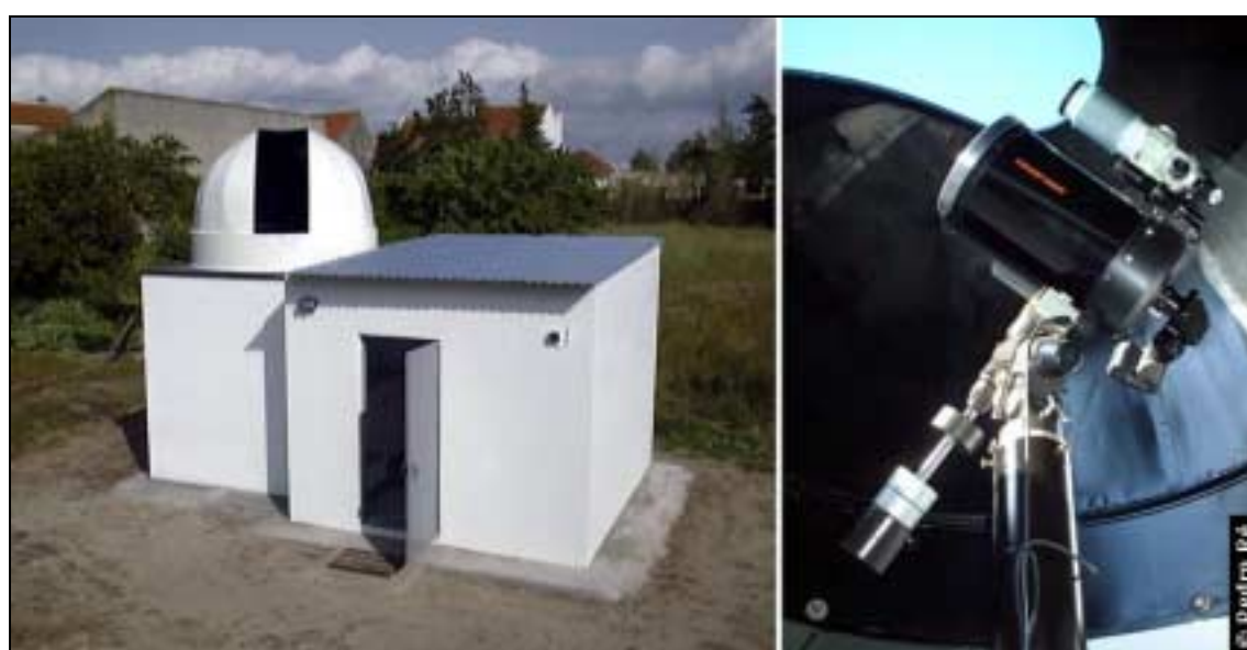
Figura 3- Aspecto final do observatório e instrumentos de observação (C8 e Vixen GP).