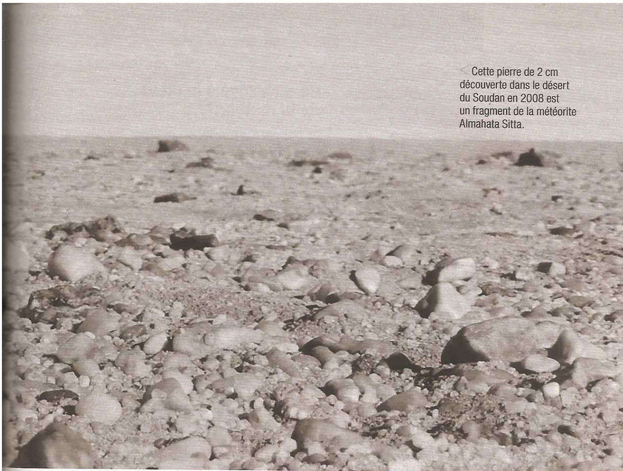
◀ Cette pierre de 2 cm découverte dans le désert du Soudan en 2008 est un fragment de la météorite Almahata Sitta.

A lmahata Sitta est littéralement un cadeau du ciel. Avant même de s'écraser sur Terre – cela se passait le 7 octobre 2008, à 2 h 46 UTC très exactement –, cette pierre sombre avait déjà mobilisé les astronomes du monde entier. Baptisée alors 2008 TC3, elle était en effet le premier astéroïde détecté dont la probabilité de collision avec la Terre était de... 100% ! À l'époque, nous avons raconté comment les scientifiques avaient pu suivre en direct son entrée dans l'atmosphère, l'impact avec le sol, puis la gigantesque battue qui avait été organisée dans le désert soudanais pour en récupérer les précieux débris (voir S&V n° 1101, p. 28).