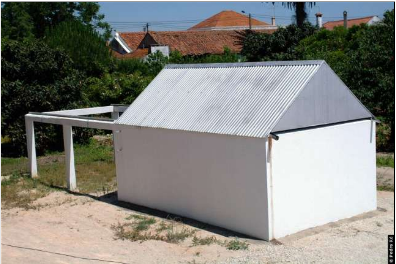
Figura 9- Observatório de Pedro Ré ( http://astrosurf.com/re/roll_off.html ).