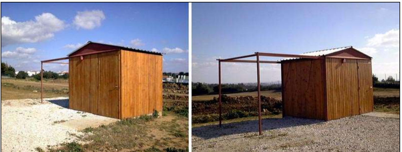
Figura 7- Observatório de tecto de correr (Centro de Medicina de Reabilitação de Alcoitão).