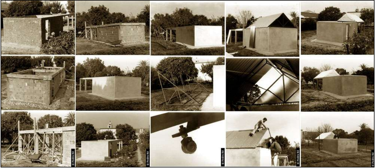
Figura 8- Observatório de tecto-de-correr construído por Pedro Ré (1978).