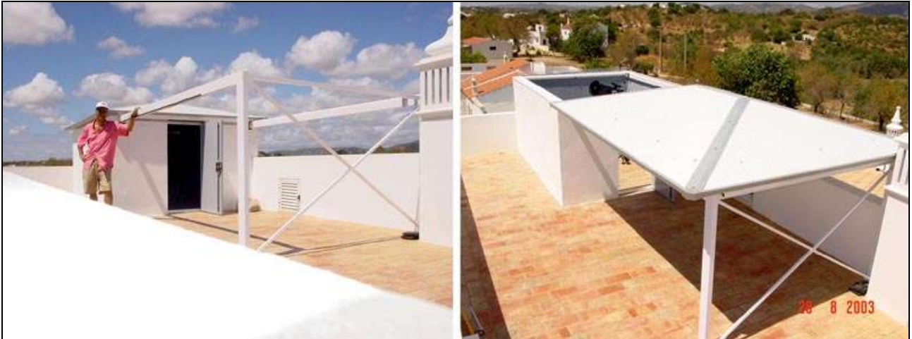
Figura 4- Observatório de tecto-de-correr construído por João Inácio.