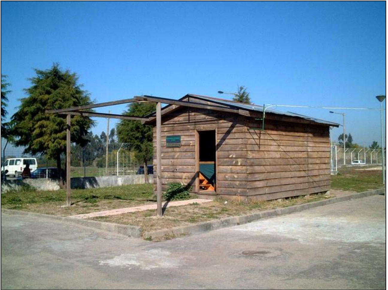
Figura 6- Observatório astronómico de Mira.