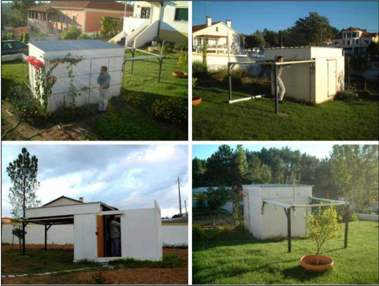
Figura 2- Observatório de tecto-de-correr construído por Rui Gonçalves ( http://golfinho.ipt.pt/~ruiocc/ ).